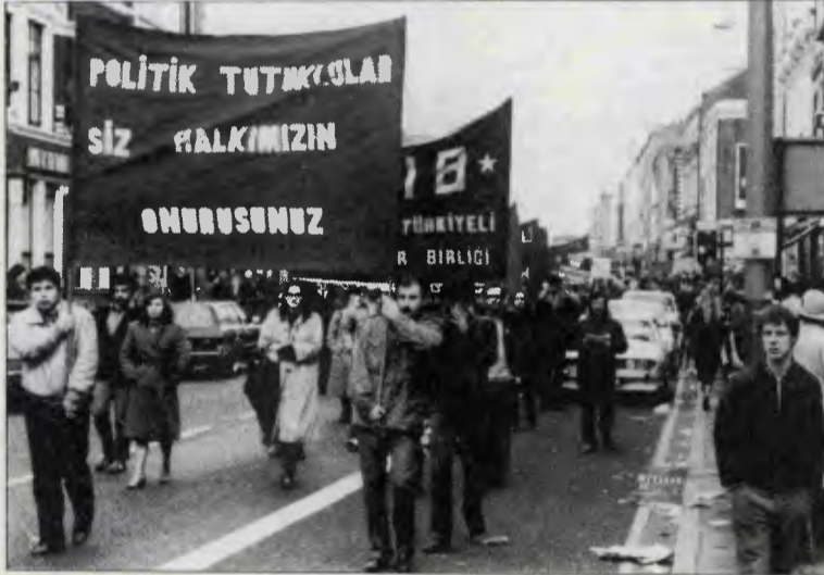
İİB'in Mamak direnişini duyurmak ve desteklemek için düzenlediği yürüyüş yankı uyandırdı.

Burjuvazi aldanıyor. Halkımızda biriken tepkinin önüne geçilemeyeceğini büyük olasılıkla gelecek günler gösterecektir. İşçi sınıfı ve halkımız, sesini zindanlardan yükselen sese daha güçlü katmak ve burjuvazinin yalanlarını başına calmak için hazırlanıyor.