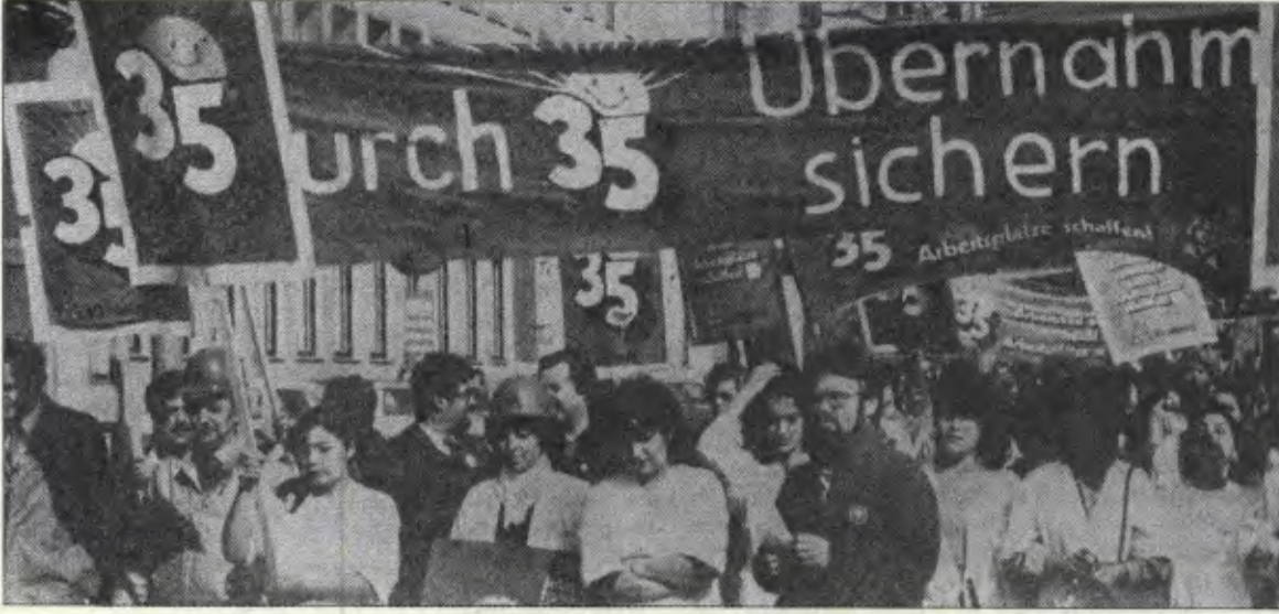
Almanya'da işçiler 35 saatlik iş haftası için yürüyorlar.