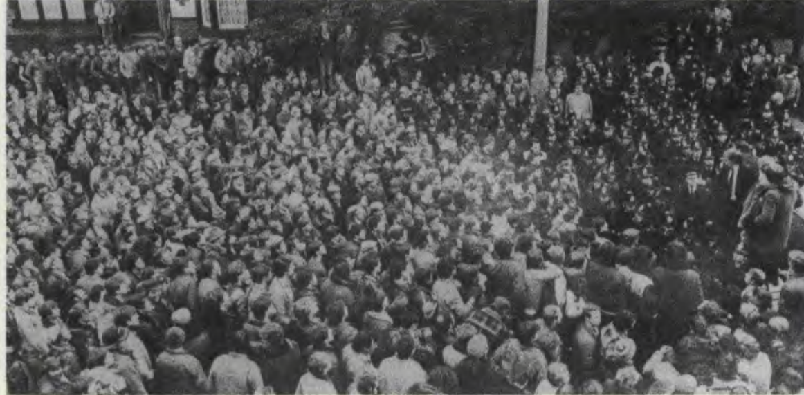
Madenciler grevinde işçiler kararlı bir savaşım sürdürüyorlar. 1974 yılında da madencilerin büyük bir grevi olmuş ve hükümetin düşmesiyle sonuçlanmıştı.

Ardından gelen 1-2 gün içinde çeşitli bölgelerdeki maden işçileri sendikaları birbiri ardından toplantılarını yaptılar. Greve karşı çıkan yalnızca Leicestershire bölgesi oldu. Di-