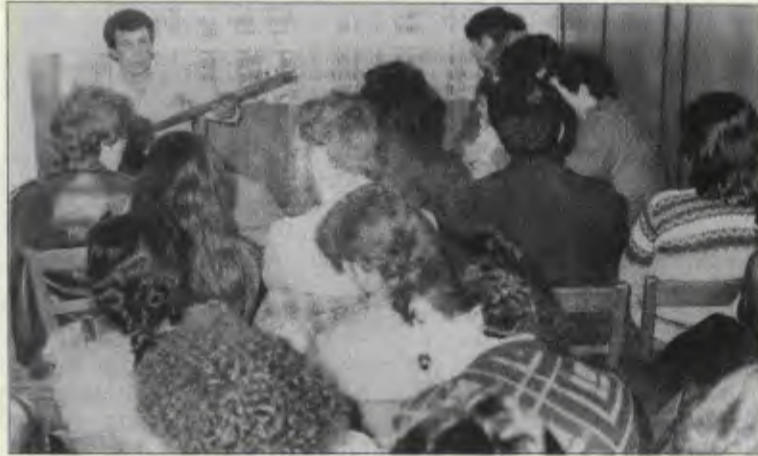
Yeni lokalde kültür çalışmalarımız da hızlandı.